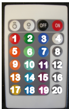
AFFECTATION DES PROGRAMMES